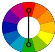
комплементарные или дополнительные цвета